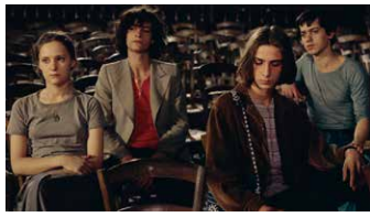
Le Diable probablement

「可視、不可視なもの、笑い、パロッドクス、ドラマといった様々なテーマが展開する作品であり、今日の映画の状況について何かを語っている映画でもある。」