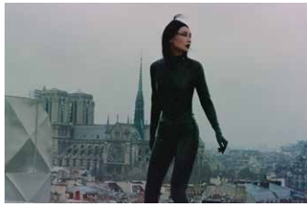
Irma Vep

「人生の様々なことに精一杯で、苦しみ、悩みながらも熱に浮かされているような、青春時代特有のロマンチックな気質の持つ暗さという意味で、これはフィルム・ノワールだ。」