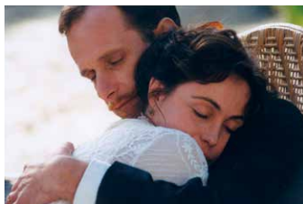
Les Destinées sentimentales

「僕の心をつねに揺さぶってきたのは、時の移ろいであり、その中で人間関係がどのように生まれ、壊れていくのか、そして世界がどのように変化し、そこにいる者たちがいかに変化し、やがて物事が消えていくのかということだ。人生とは、それに価値があるか否かは別として、計り知れないほどの回り道を経て、最終的に自分自身へと立ち返る道のりなのだと思う。」