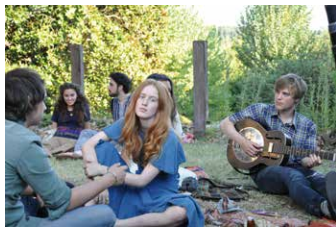
Après mai

1970～80年代に世界を震撼させた伝説のテロリスト、イリッチ・ラミス・サンチェス(通称カルロス)の半生を、史実や報道をもとに描いた超大作。複数の偽名と人生を使い分け、当時の国際政治の複雑な動きを横断していったカルロスとは一体何者だったのか？ 複数の女性たちに愛され、彼女たちに守られながら逃走を続けた男の正体とは？ 70年代の武装闘争は複数の国、文化の交差点で行われ、世界的な流れとなっていたが、そうした国際的な規模で起こった出来事、動きを見事に捉えながらも、親密な人間関係も繊細かつ官能的に描き上げたアサイヤスの頂点ともいえる作品。