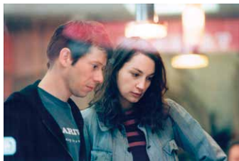
Fin août début septembre

「現代において絵画における印象派のような映画への道、方法を探していた。日常生活とアートの実践が同じひとつのものであり、互いが淀みなく流れ、循環し合っていくような道を。そしてマチュー・アマルリックら、ヌーヴェルヴァーグの俳優たちが持っていた現代性、知性、自然さを兼ね備えた存在と出会い、映画が始動し始めた。」