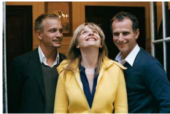
L'Heure d'été