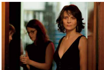
Sils Maria