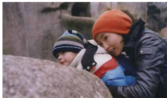
Clean ©2004 - Rectangle Productions / Leap Films / 1551264 Ontario Inc / Arte France Cinema

歌手としての成功を夢見るエミリーだったが、夫をドラッグの過剰摂取で亡くしてしまう。愛する人を亡くした哀しみの中、幼い息子も手放すことに…。6ヶ月後、エミリーはもう一度全てをやりなおそうと決意し、息子との絆を取り戻そうとする。マギー・チャンは、本作で第57回カンヌ国際映画祭女優賞を受賞。「僕はマギーに、できるだけ落ち着き、抑制の効いた演技をしてほしいと伝えた。この映画では、感情は皮膚の下にひそみ、あからさまに表に出ることはない。本作が焦点を当てているのは、「悔い改めることの可能性」を観客がどこまで受け入れられるか、という点なのだ。」